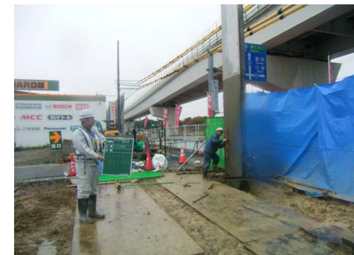
コンクリート矢板建込状況