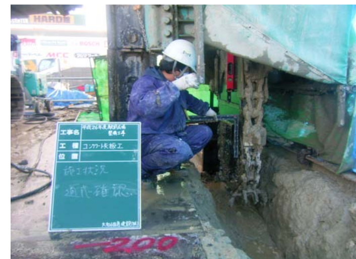
通芯レーザー確認状況