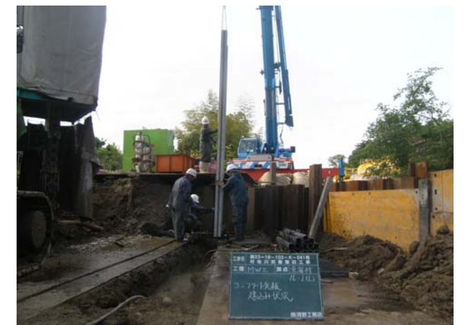
コンクリート矢板建込状況