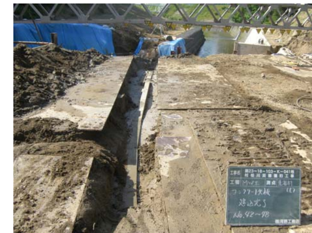
コンクリート矢板建て込み完了端末部