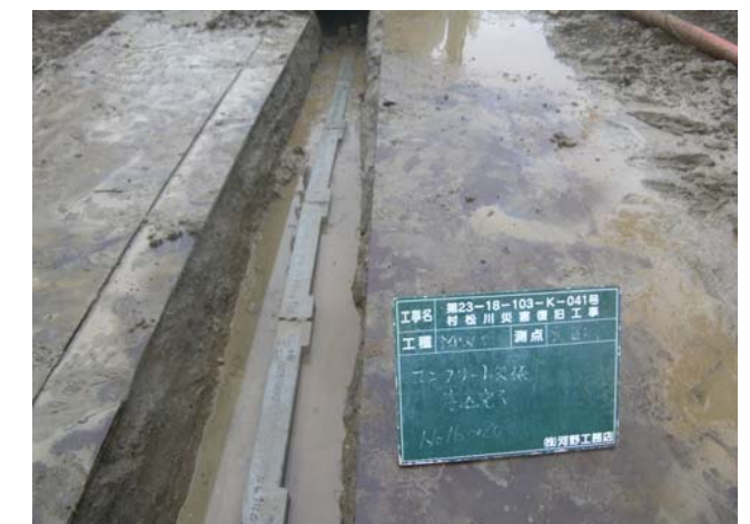
コンクリート矢板建て込み完了