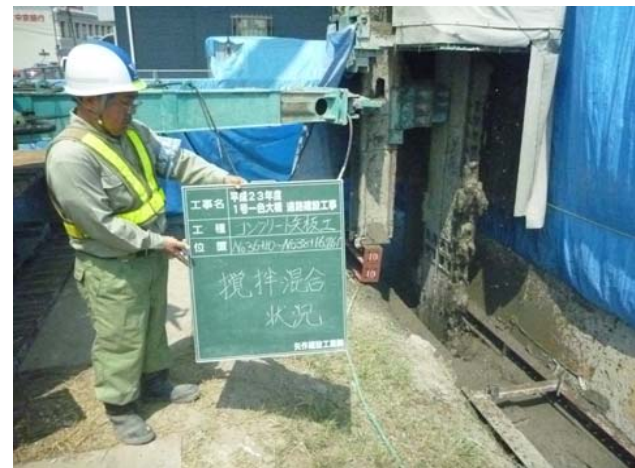
掘削ソイル連続壁造成