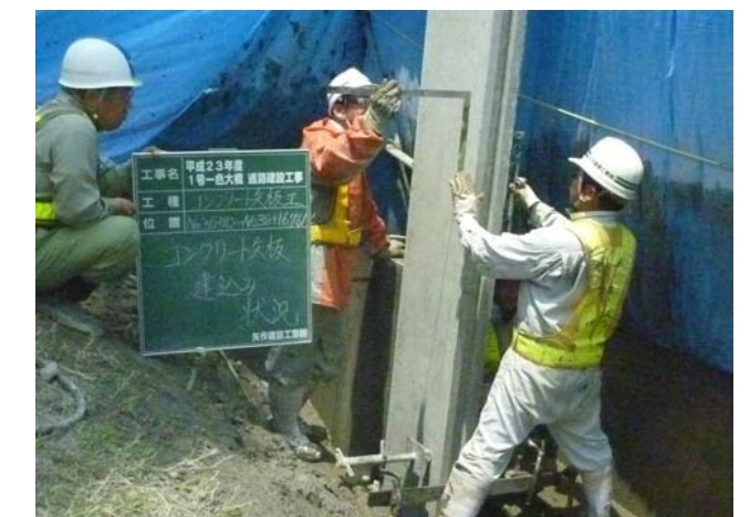
コンクリート矢板建て込み