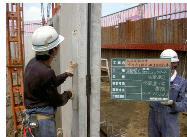
コンクリート矢板法線確認