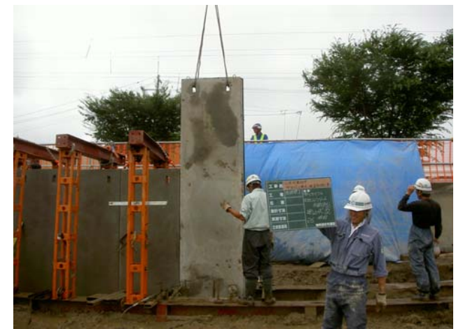
コンクリート矢板建込