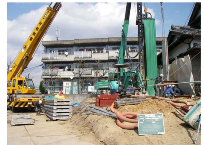
コンクリート矢板建込状況