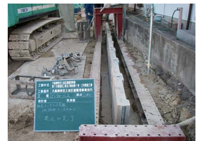
コンクリート矢板建込完了