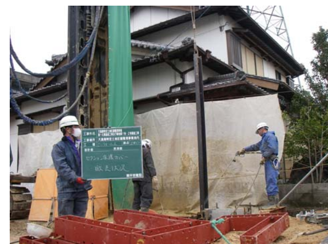
前日施工セクション保護材引抜