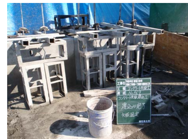
コンクリート矢板固定状況