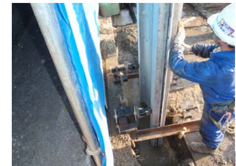
コンクリート矢板建込状況