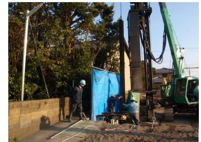
セクション保護鋼材挿入状況