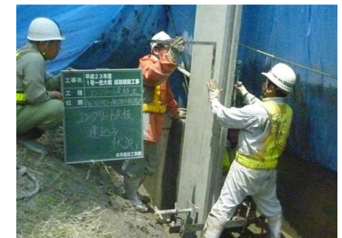
コンクリート矢板建て込み