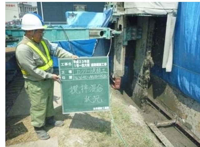
掘削土壌連続壁造成