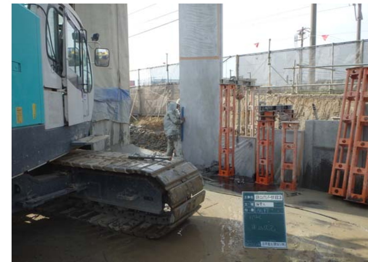
コンクリート矢板建込状況