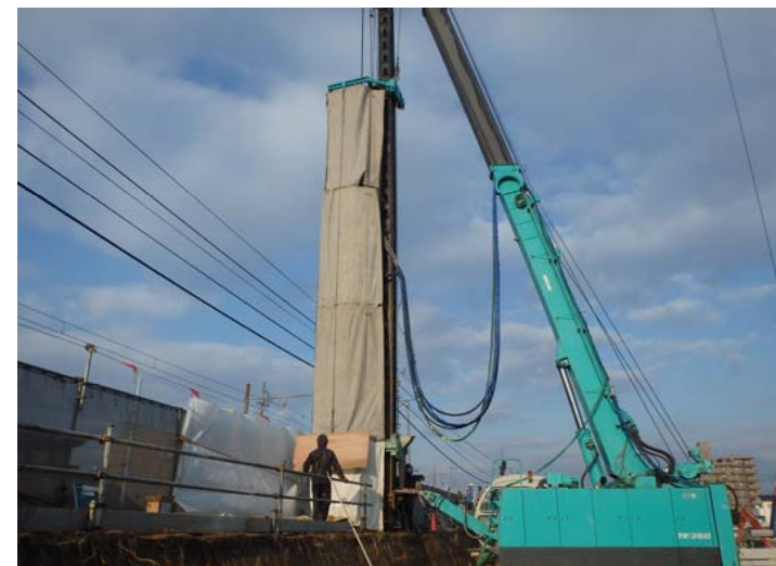
施工全景 軌道近接施工